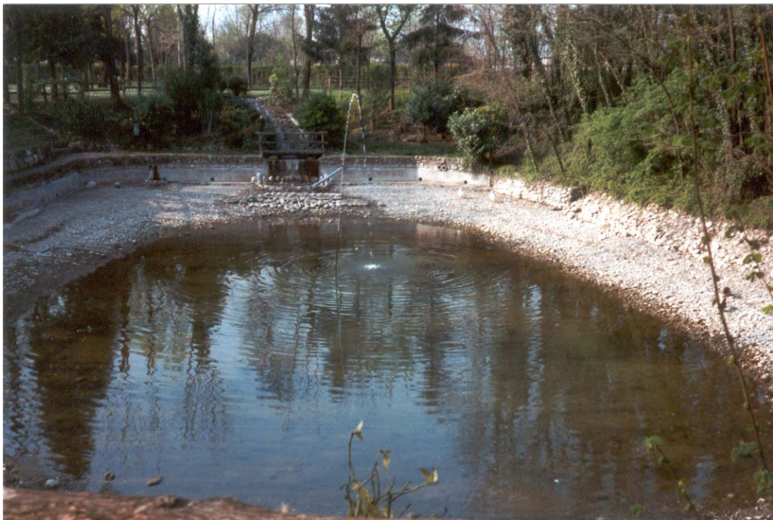
Foto n. 8 Fontanile San Rocco in comune di Spirano (Aprile 2003).

Comune di Urgnano (Provincia di Bergamo)