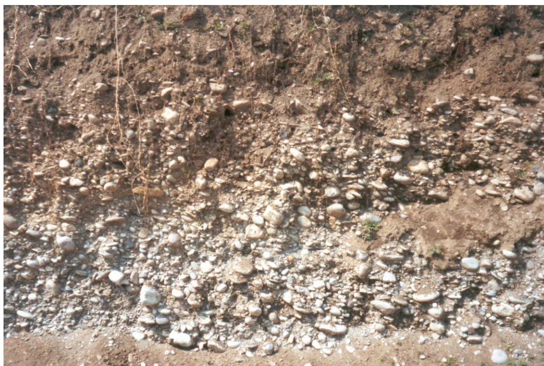
Foto n. 15 Panoramica dei terreni presenti nello scavo n. 10 (Gualda Vecchia).

Comune di Urgnano (Provincia di Bergamo)