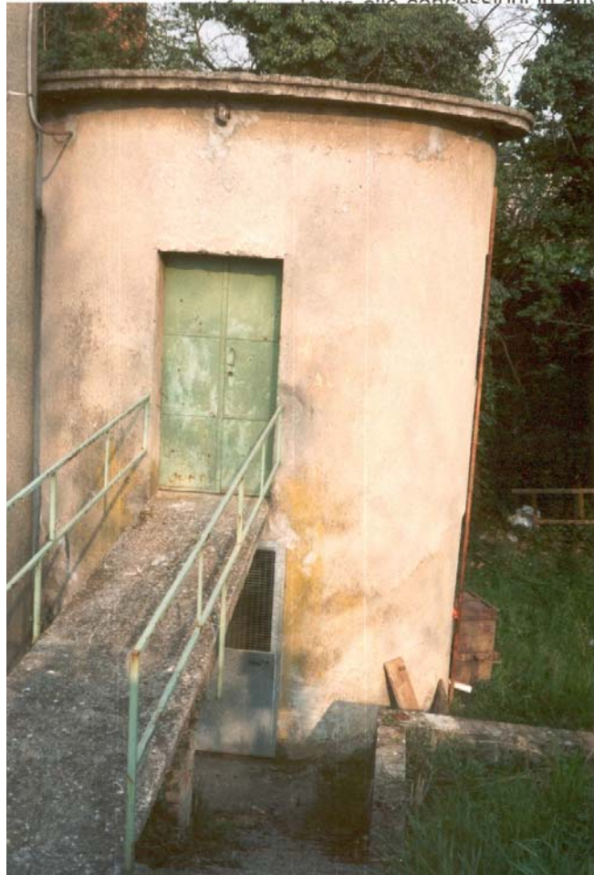
Foto n. 9 Pozzo irriguo realizzato all'interno della testata di un fontanile estinto negli anni '30 (Urgnano Sud).