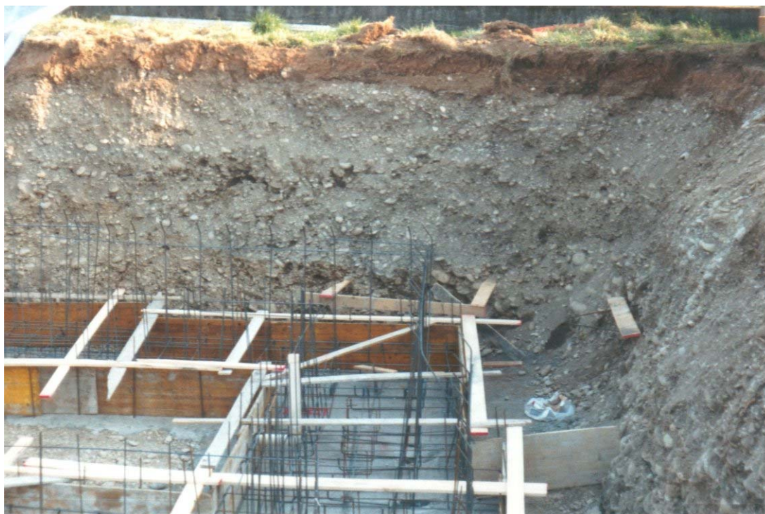
Foto n. 14 Panoramica dei terreni presenti nello scavo n. 2