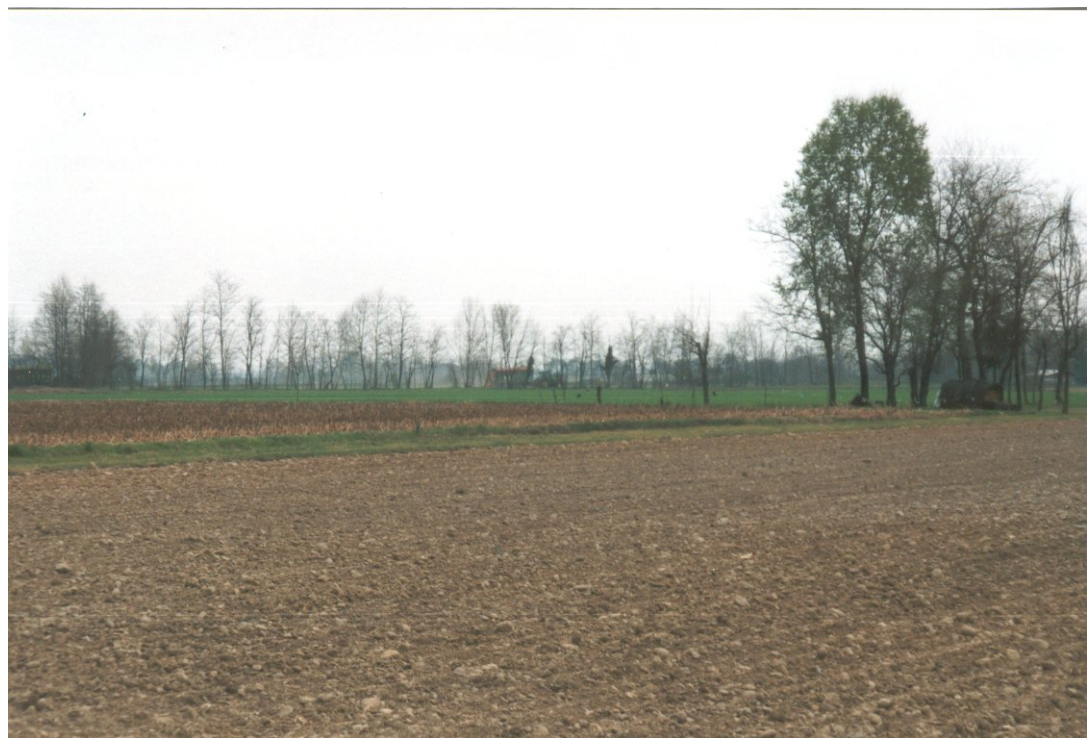
Foto n. 19 Panoramica dei terreni a sud della frazione Basella.