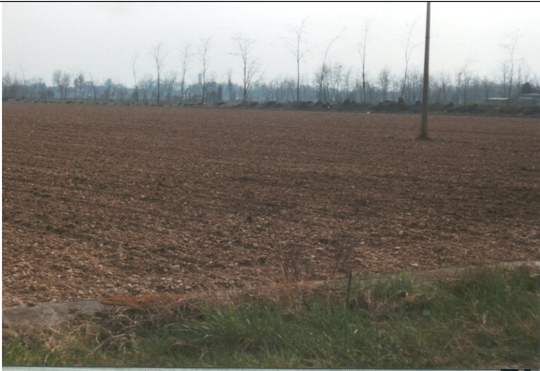
Foto n. 18 Panoramica dei terreni presenti nella porzione meridionale del territorio comunale.