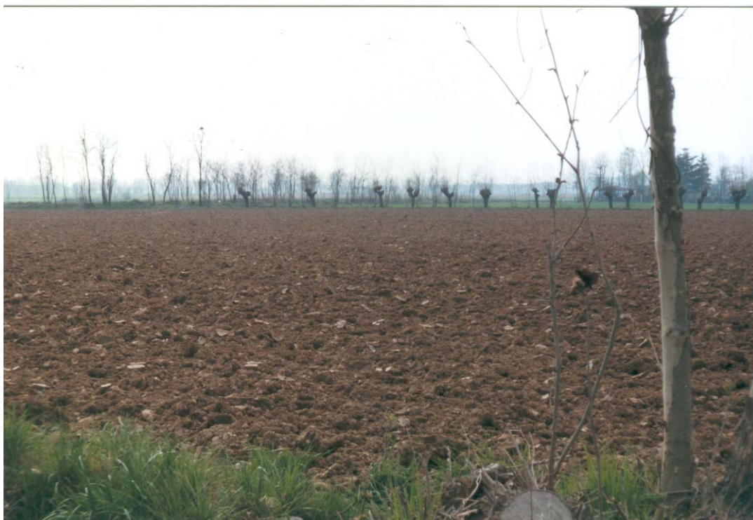
Foto n. 16 Panoramica dei terreni a nord dell'abitato.