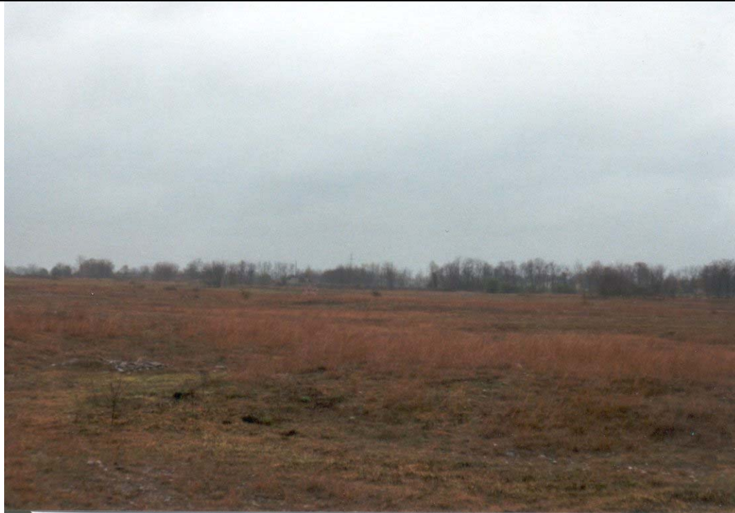
Foto n. 3 Panoramica delle alluvioni recenti a lato del fiume Serio