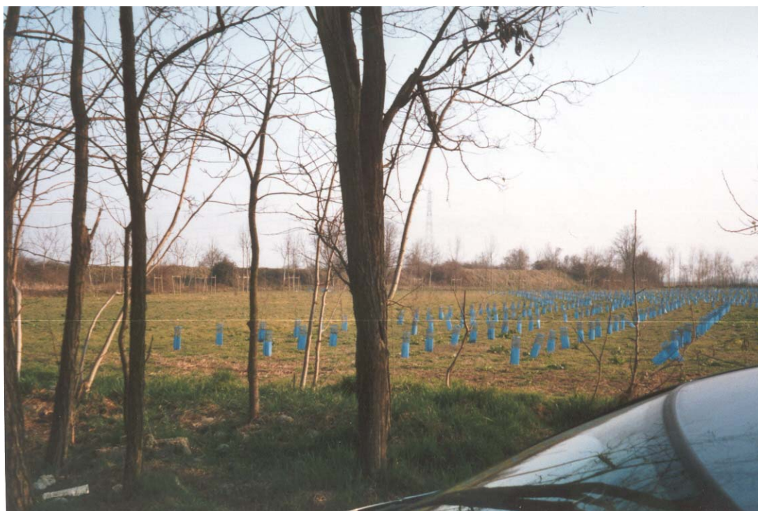
Foto n. 4 Argine in terra che protegge la zona est della frazione Basella.