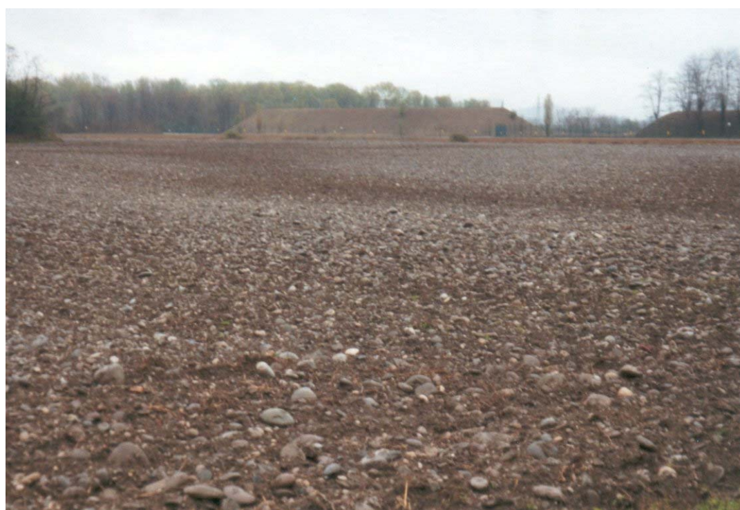
Foto n. 17 Panoramica dei terreni a nord della frazione Basella (polveriera Fiocchi).

Comune di Urgnano (Provincia di Bergamo)