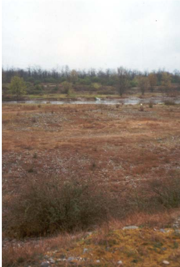
Foto n. 1 Alveo attuale fiume Serio (zona nord territorio comunale). Visibile la scarpata che lo delimita.