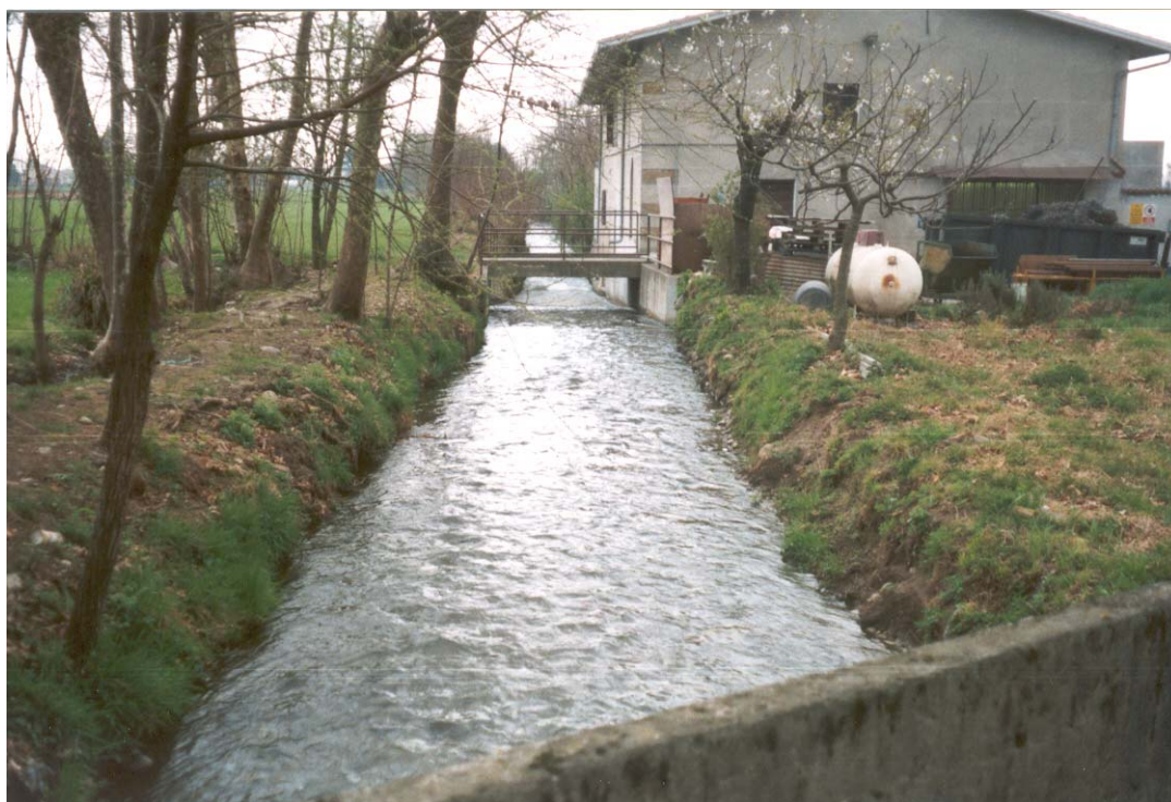
Foto n. 5 Roggia Urganana a nord della frazione Basella.