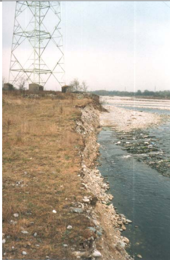
Foto n. 20 Erosione di sponda in corrispondenza di un traliccio dell'alta tensione.