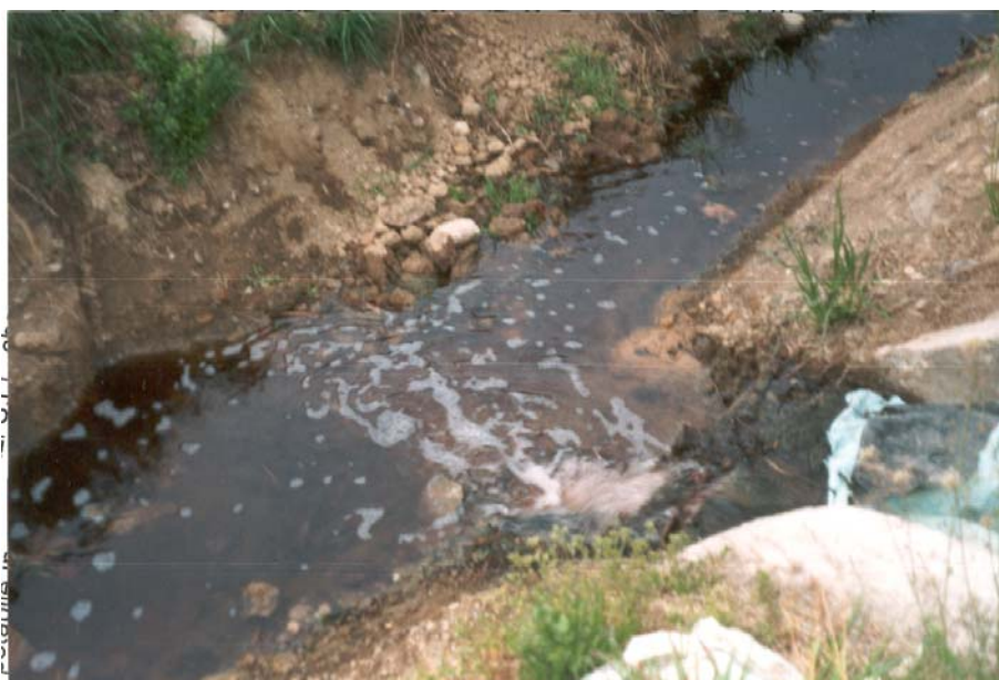
Foto n. 6 Scarichi in roggia

Comune di Urganano (Provincia di Bergamo)