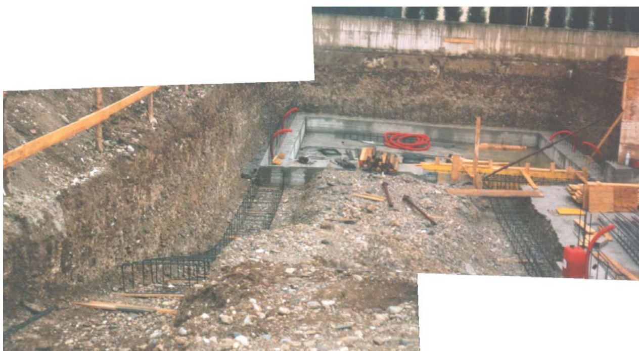
Foto n.11 Panoramica dei terreni presenti nello scavo n. 6

Comune di Urgnano (Provincia di Bergamo)