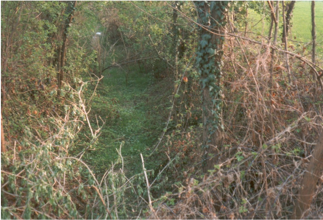
Foto n. 7 Testa di fontanile estinto all'estremità meridionale del territorio comunale.