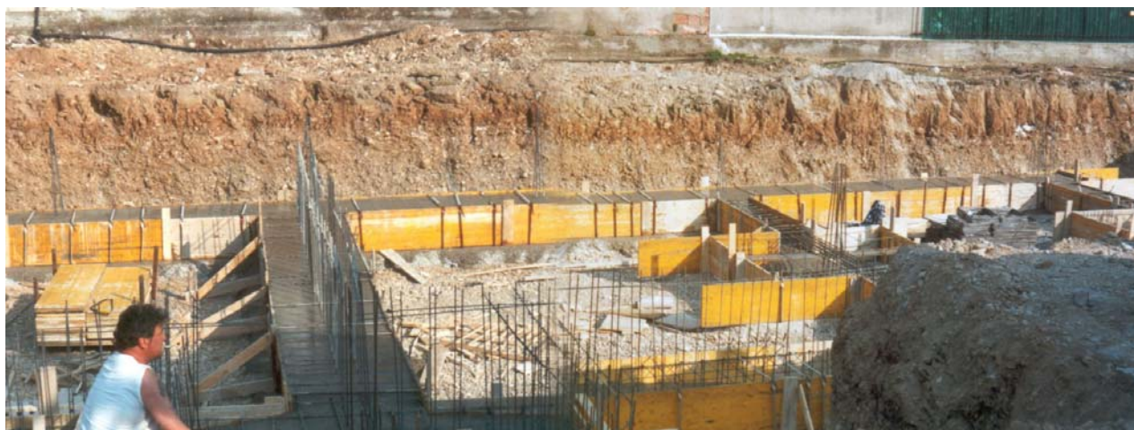
Foto n.10 Panoramica dei terreni presenti nello scavo n. 5