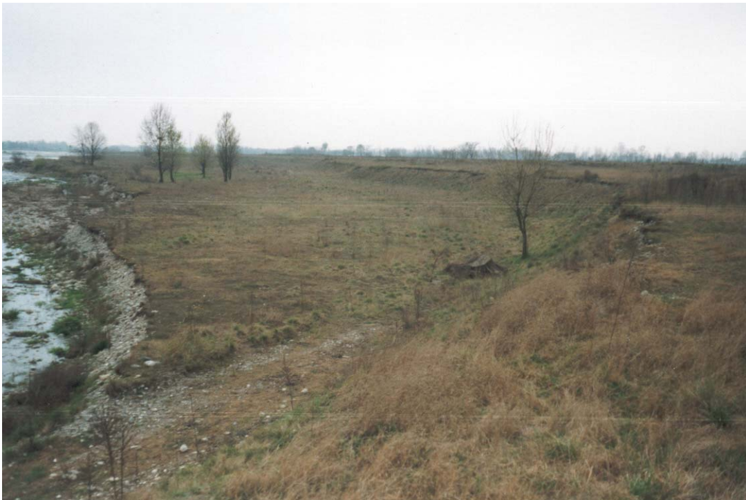
Foto n. 2 Orlo di terrazzo recente e orlo di terrazzo attuale che delimita l'alveo del Serio.

Comune di Urgnano (Provincia di Bergamo)