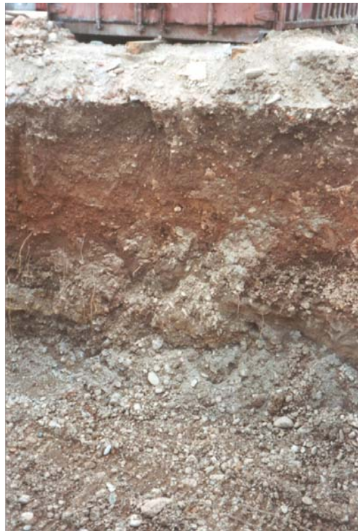
Foto n. 12 Panoramica dei terreni presenti nello scavo n. 7